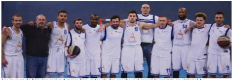
Les joueurs de l'équipe senior 1 masculine, entourés des coachs, ont assuré la montée en régional 1

La saison 2017-2018 restera un sacré millésime pour le club de basket de Saint-Jacques-sur-Darnétal ! La section basket de l'Union sportive de Saint-Jacques omniparts, présidée par Dominique Méraud, compte actuellement 100 licenciés, répartis en douze équipes, allant de l'école de mini-basket, dès 5 ans, aux seniors, avec deux équipes en élite, les U17 filles et U20 garçons, deux équipes en régional, les U15 et U17 garçons.