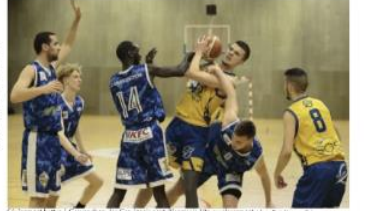
Séverement battu à Granville, les Cougars ont remporté l'U16 au Championnat de France féminin

« Une belle victoire pour Saint-Jacques sur Darnétal. Les deux équipes ont joué un basket très physique et très technique. On a vu beaucoup de belles actions et de belles défenses. C'est une victoire méritée et on se réjouit de cette montée sur le podium. »